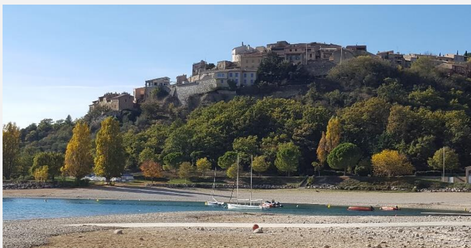
Sainte-Croix en novembre

Nous vous invitons donc à vous rendre à l'adresse : https://sites.google.com/view/cnlscv pour vous communiquer votre avis. Nous vous en remercions.