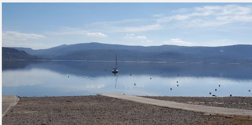
Notre lac paisible en novembre